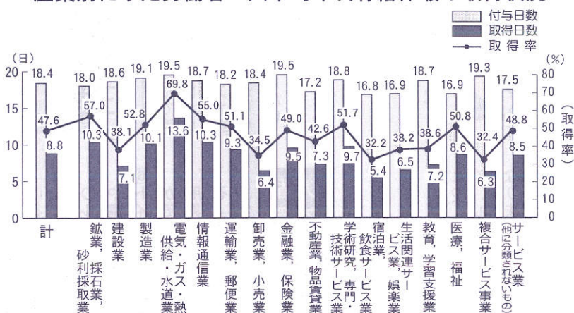
産業別にみた労働者1人平均年次有給休暇の取得状況

一日の所定労働時間は、一企業平均七時間四五分(前年七時間四三分)、労働者一人平均七時間四五分(同七時間四四分)