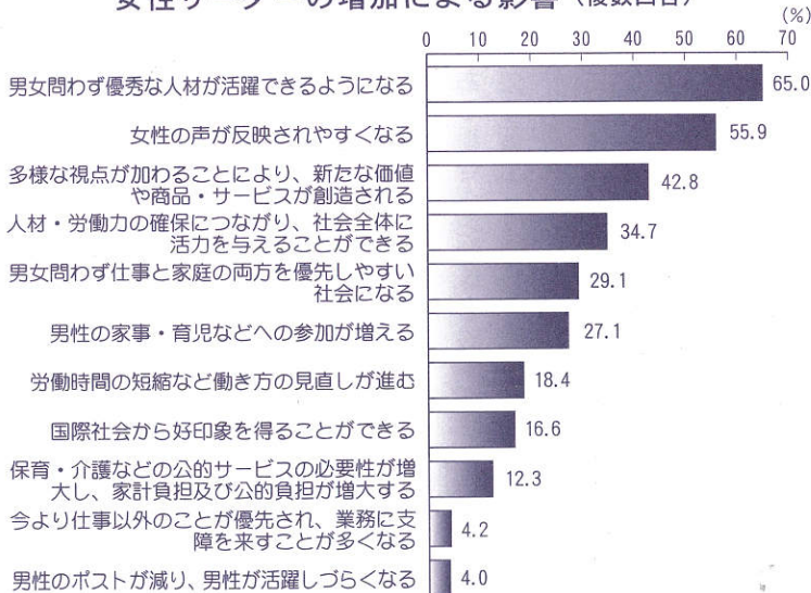
女性リーダーの増加による影響 (複数回答)

が増えるなどのような影響があると思うか聞いたところ、「男女問わず優秀な人材が活躍できるようになる」が65・0％と最も高く、以下、「女性の声が反映されやすくなる」(55・9％)、「多様な視点が加わることで、新たな価値や商品・サービスが創造される」(42・8％)などの順となった。(左図参照)